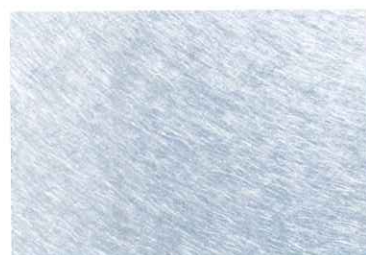
●シルバー仕上げ スチールオリジナルパイプレーション研磨 ※シルバー仕上げは1本から製作しております。